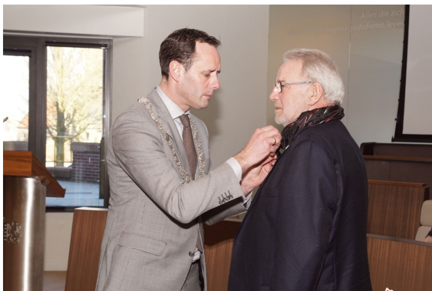
Opspelden van de erespeld van Harderwijk